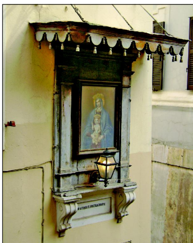
L'edicola della Madonna della Libera in via San Gennaro

e della Libera. Tra i Santi raffigurati abbiamo notato (oltre il nostro patrono S. Sisto), Santa Rita, S. Francesco, S. Rocco e infine S. Antonio.