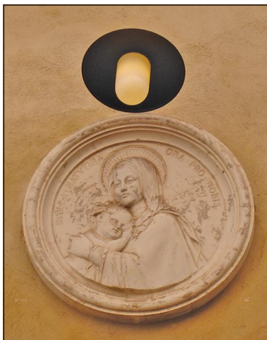
L'edicola dedicata alla Stella Mattutina nel rione Santa Lucia

Stiamo parlando delle discrete, rassicuranti e familiari edicole sacre: immagini di Madonne e di Santi che costellano le facciate delle case della città (specie del Centro storico) e la cui origine affonda nella fede popolare alatrense, quando per ringraziare il Signore o per supplicarlo la gente costruiva piccoli tabernacoli per poi venerarli quotidianamente. Da uno studio del collega Pietro Antonucci sappiamo che queste immagini sacre ad Alatri sono oltre cinquanta e risalgono, nella maggior parte, all'800 o all'inizio del secolo scorso. La figura più ricorrente è quella della Madonna: Immacolata Concezione, Immacolata di Lourdes, Stella Mattutina, Madonna del Velo, Madonna di Pompei, del Buon Consiglio, della Provvidenza, del Rosario, del Carmine