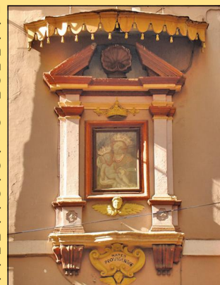
L'imponente e bella edicola sacra all'inizio della strada che conduce all'Acropoli